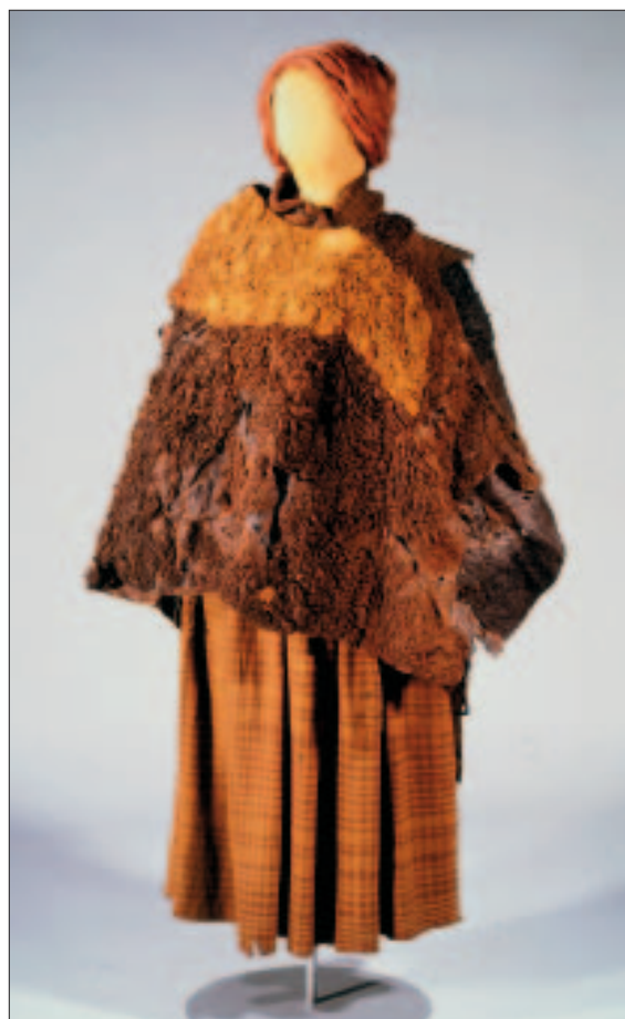
Fig. 7. Skindslag (type B) fra Huldremose. Slaget på gine.

Mange af slagene er reparerede (Mannering & Schmidt 2007).