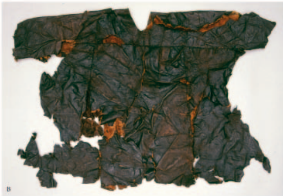
Fig. 2. Skinddragten fra Møgelmose ved Jelling. A. Forsiden. – B. Rygsiden. The skin garment from Møgelmose near Jelling. A. Front. – B. Back.