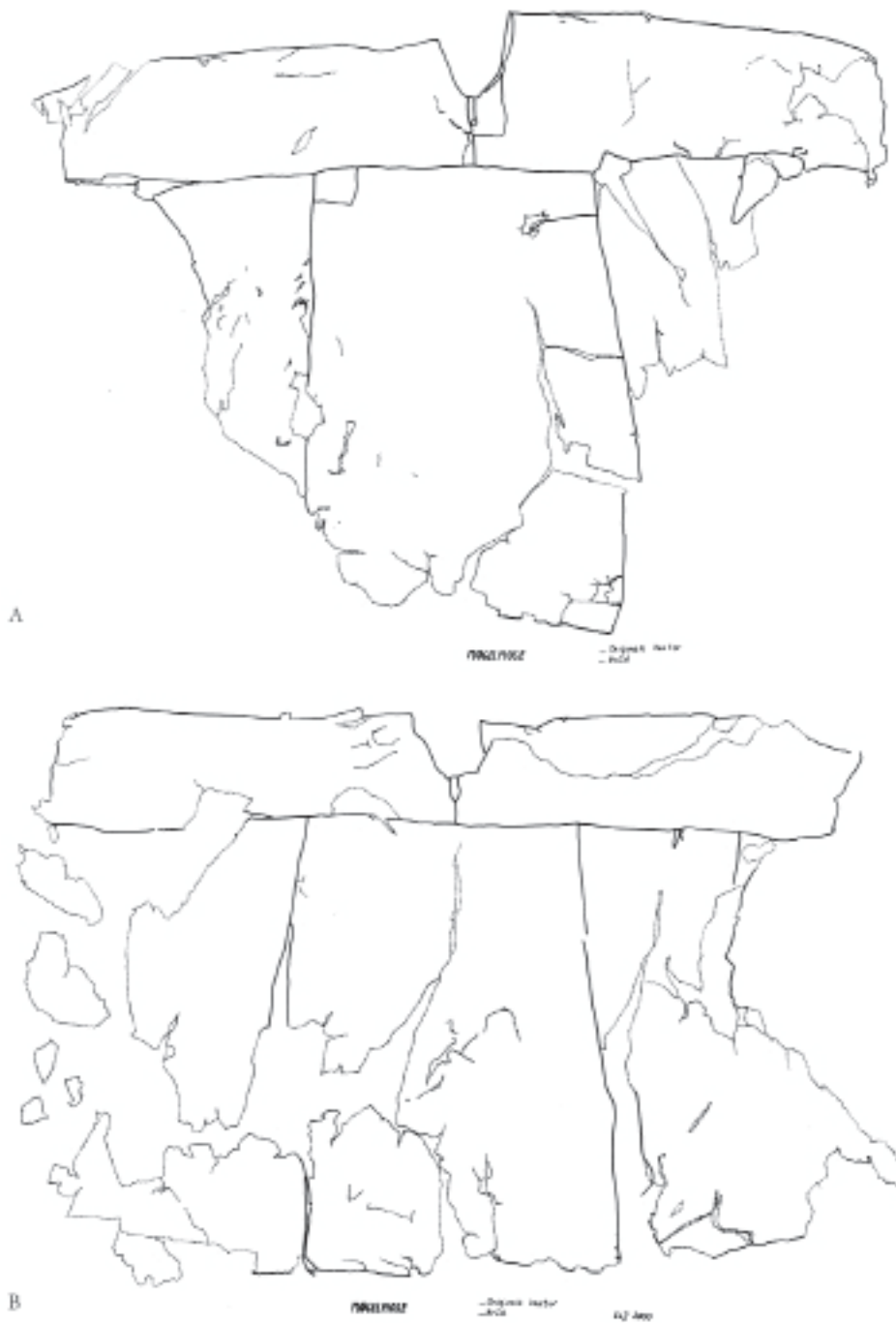
Fig. 1. Skinddragten fra Møgelmose ved Jelling. A. Forsiden. – B. Rygsiden. Eva L. Jørgensens opmåling, år 2000. The skin garment from Møgelmose near Jelling. A. Front. – B. Back. Eva L. Jørgensen's measurements, 2000.