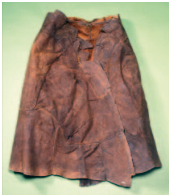
Fig. 6. Skindslag (type A) fra True Mose, Midtjylland.

Type A (fig. 6) er defineret som symmetriske skindslag med en slags krave eller bærestykke som – uanset om disse er dannet af ét stykke skind eller flere, der er sat sammen – er lige gennemløbende ved overkanten. Der kendes mindst otte slag af denne type (kat. nr. 7 (mindst to), 13, 14, 15 (mindst tre) og 18) hvoraf de fem er dateret til førromersk jernalder. Stykkerne er nogenlunde lige store og ens sammensatte. Blandt slagene af denne type er mange rigtig lange (kat. nr. 18). Skindene er ca. 80 cm høje, 150-200 cm brede og med en halsåbning på kun ca. 60 cm. Slag af denne slags blev båret