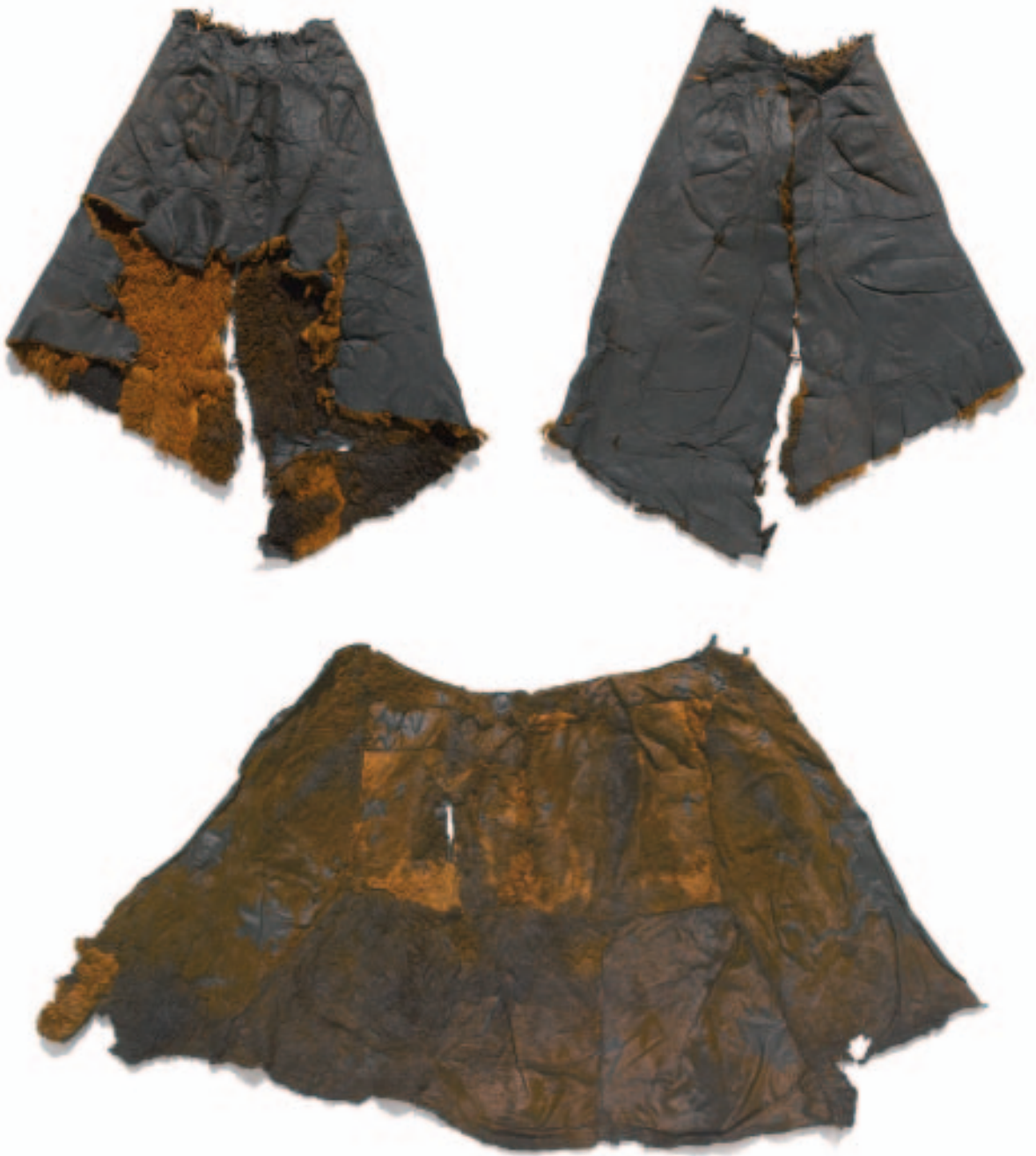
Fig. 5. To skindslag fra bronzealderen, fundet i Borremose. Øverst C 26450, rygside (t.v.) og forside (t.h.). Nederst C 26449.

Two skin capes from the Bronze Age, found in the bog Borremose. Above C 26450, rear (left) and front (right). Below C 26449.