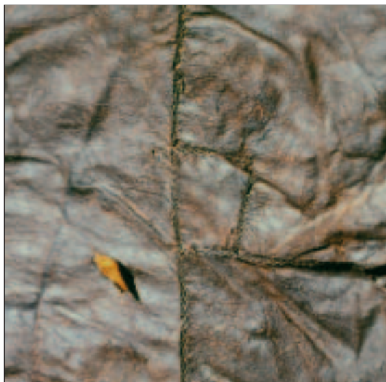
Fig. 4. Skinddragten fra Møgelmose ved Jelling. Reparation af øverste, venstre hjørne af forsides midtstykke.

I forbindelse med denne undersøgelse af skinddragten er fibrene blevet analyseret af H.M. Apple-